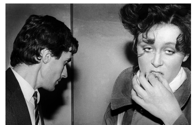
Pontoise, 1972