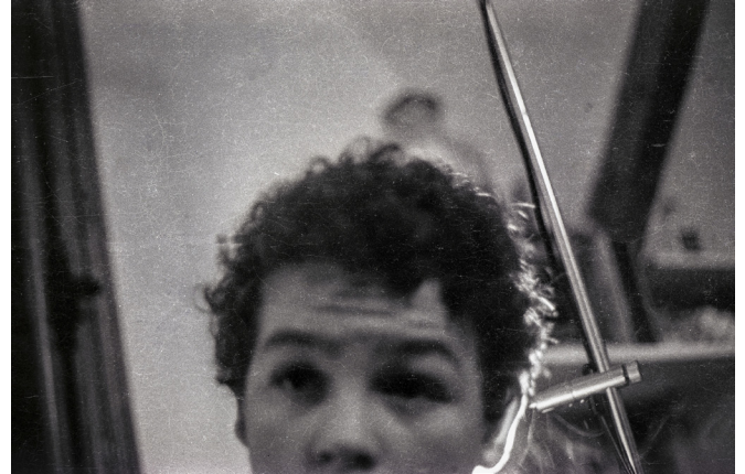
Autoportrait, 1971 © Franck Landron